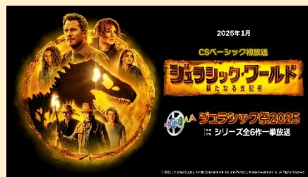
『ジュラシック・ワールド／新たなる支配者』© 2022 Universal Studios, Amblin Entertainment, Inc. and Perfect Universe Investment Inc. All Rights Reserved.

特設ページ： https://www.thecinema.jp/special/jurassic/